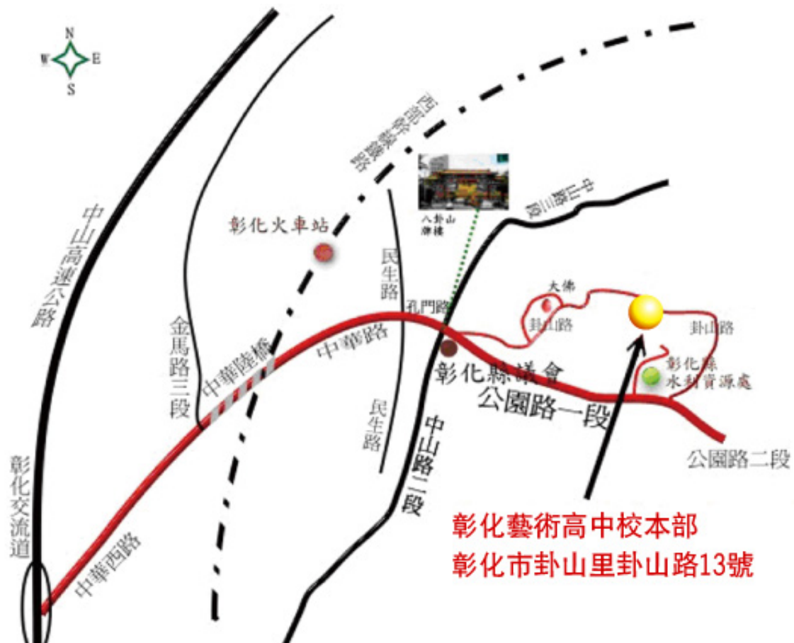
附圖、彰化縣立彰化藝術高級中學位置交通路線簡圖