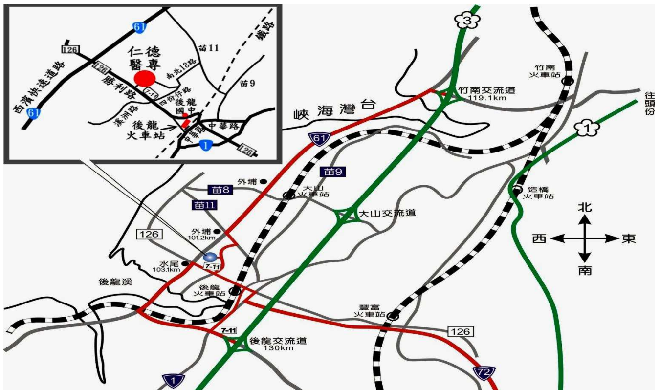
(仁德醫護管理專科學校位置圖)