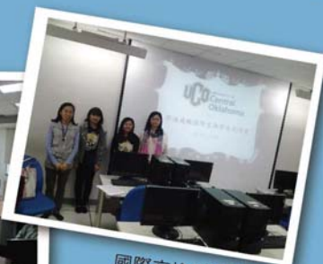
國際交換學生說明會