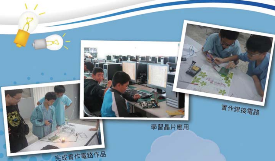
完成實作電路作品

適合就讀的特質：喜歡研究與安裝數位（3C）產品、修理與拆解數位娛樂與家電用品，如遊戲機、筆記型電腦、音響、電視機等、喜歡參觀資訊展、對研究智慧型或對自動控制產品具好奇心及興趣者。