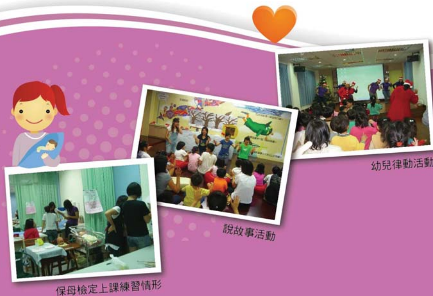
保母檢定上課練習情形