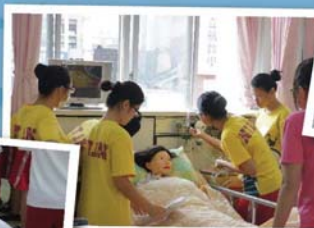
模擬使用中央系統氧氣