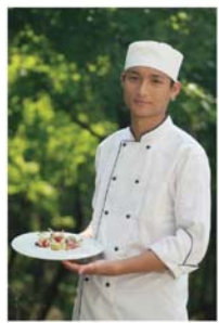
廚藝作品成果發表