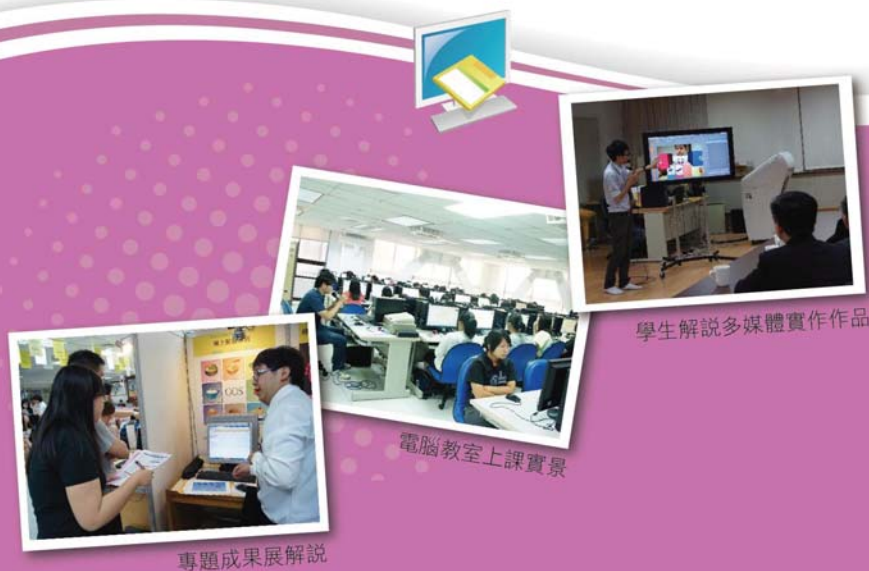
學生解說多媒體實作作品

適合就讀的特質：喜歡閱讀數位（3C）產品雜誌、喜歡參觀資訊展、對系統/網頁設計有興趣者。