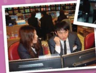
學生至證券公司實習