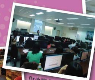
財金實作課程上機操作