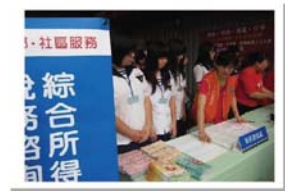
綜合所得稅申報服務

培養商業服務、商業計算、現代經營技能及資訊科技應用、銷售服務、製造作業管理、公司理財與管理會計、人力資源與組織管理、資訊管理、策略管理、國際商務管理、科技管理及財稅、金融等人力。