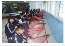
漁業科漁網編織教學