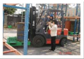
物流課程堆高機操作