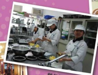
麵包課程實作教學