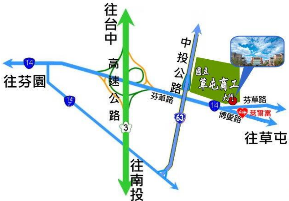
附圖 一 承辦學校（國立草屯高級商工職業學校）位置圖