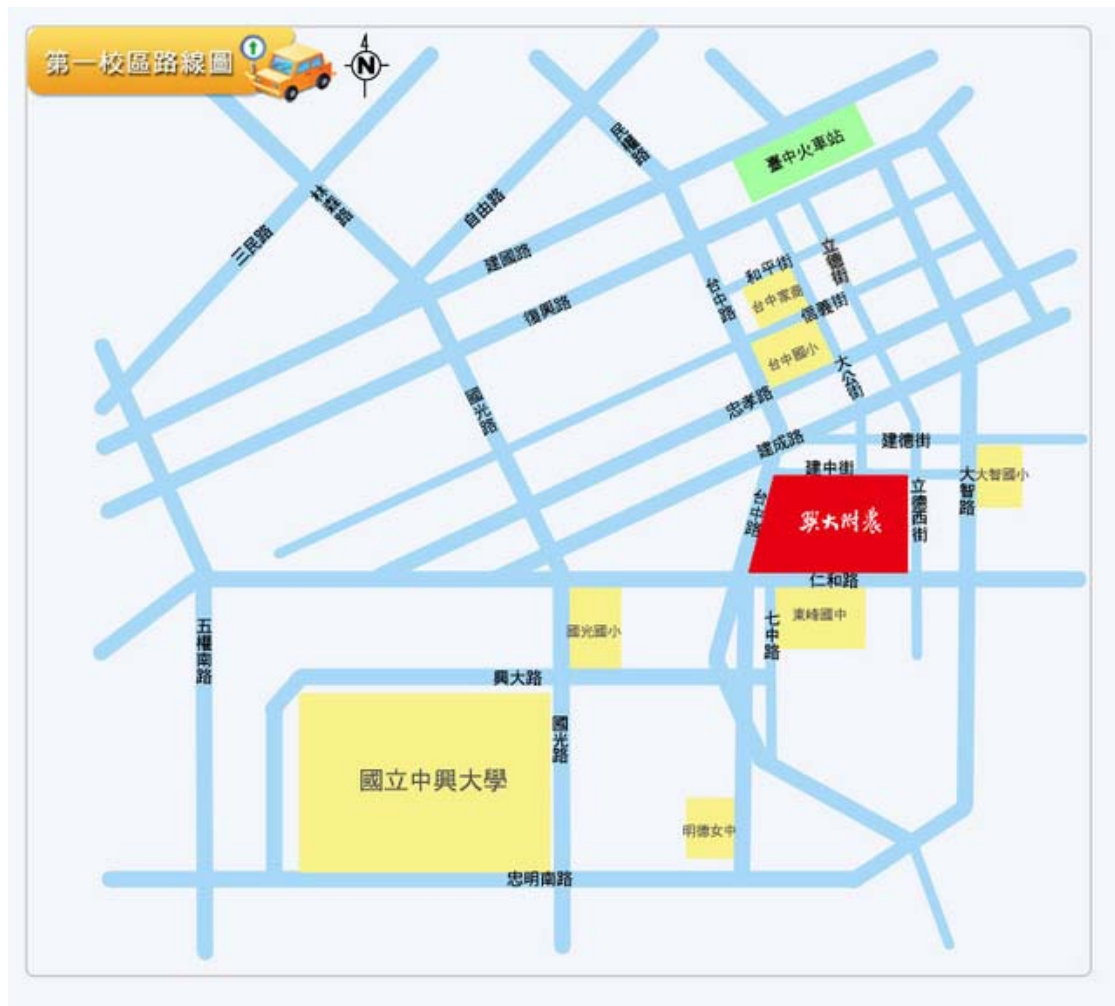
附圖一 承辦學校位置圖