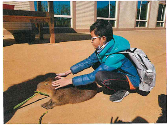
近距離接觸 按摩水豚