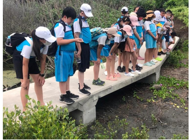
說明：王功生態步道課程。