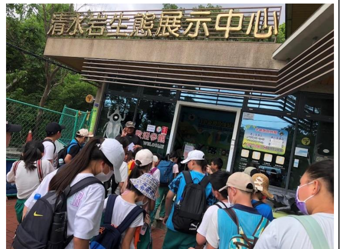
說明：清水岩生態展示中心課程。