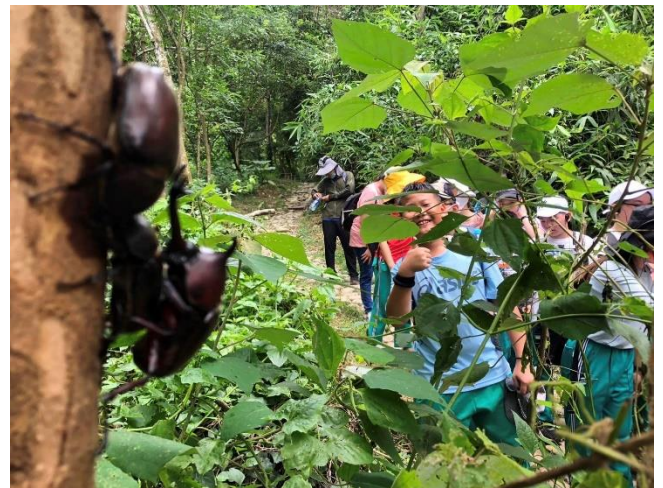
說明：認識八卦山動植物。