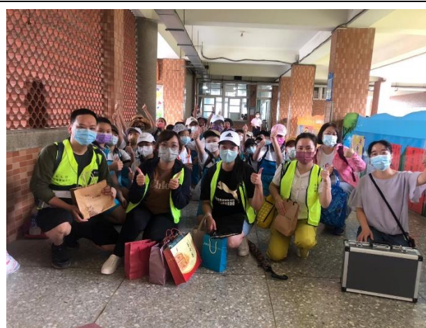
說明：出發前，親師生分工。