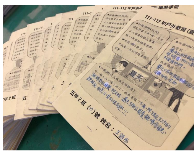
說明：自主學習手冊製作。