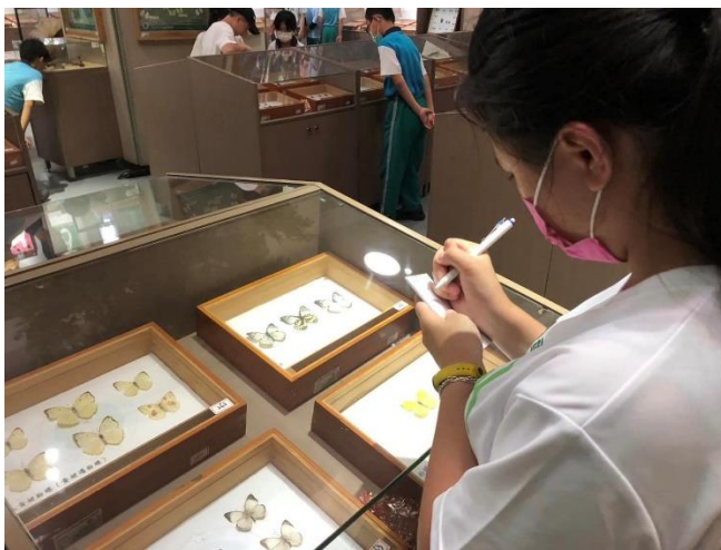
說明：仔細觀察標本。