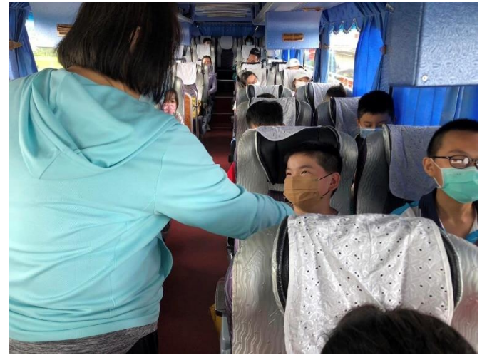
說明：家長同意書及志工家長徵召。