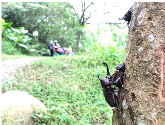
說明：挑鹽古道獨角仙課程。