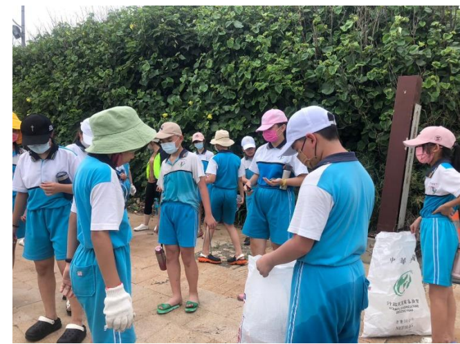
說明：服務學習課程/淨山、淨灘及鹿港詩歌朗讀