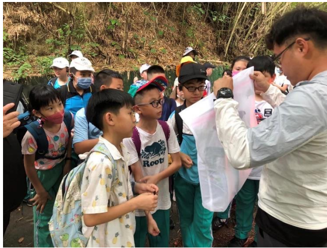
說明：藤山步道課程。