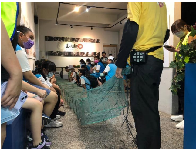
說明：王功故事館課程