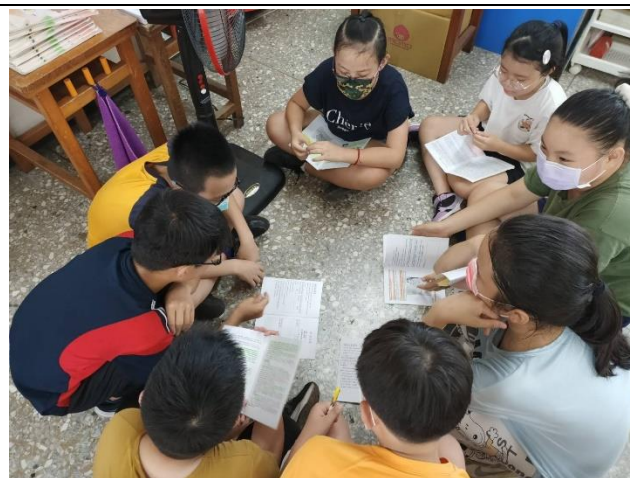
說明：共同約定，戶外教育安全事項。