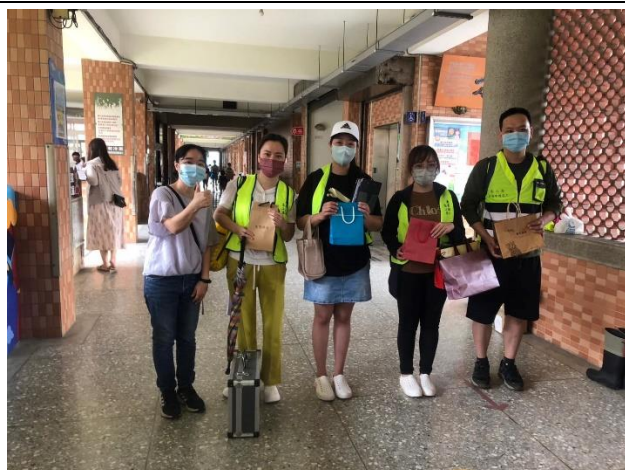
說明：家長同意書，及家長志工徵召。