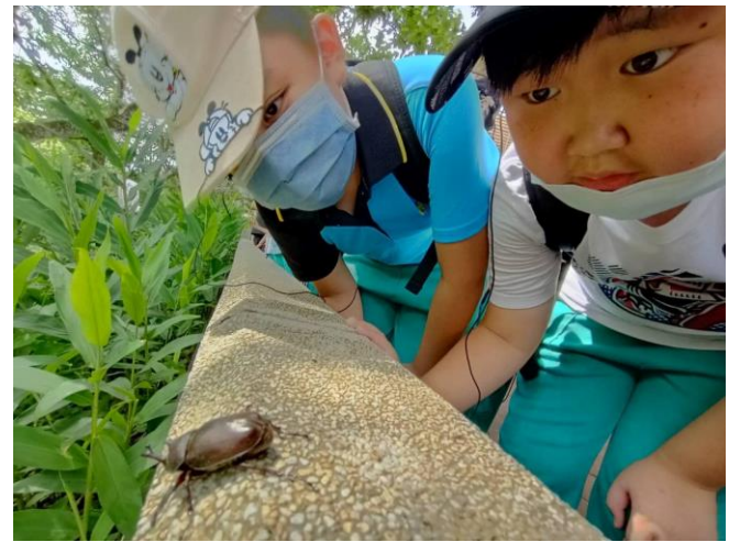
說明：微熱山丘課程。