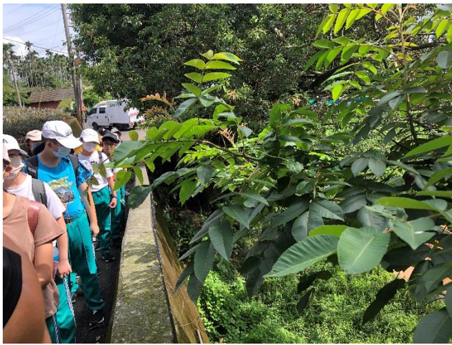
說明：認識八卦山動植物。