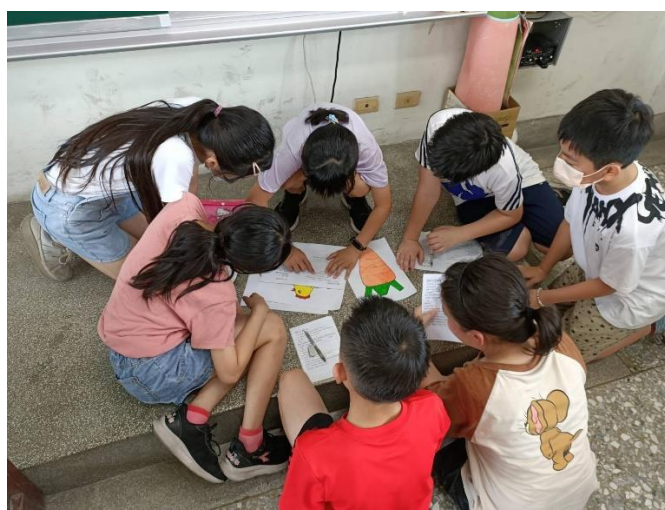
說明：學習議題影片拍攝討論。