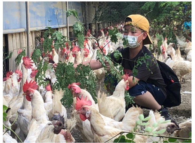
說明：御品園放牧場課程。