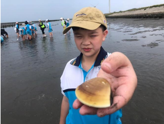
說明：王功潮間帶課程