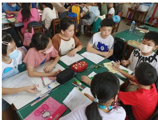
說明：課程說明，自主學習共識。