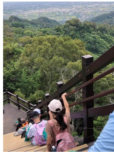
說明：茶園步道休憩、高處獨處見彰化平原。