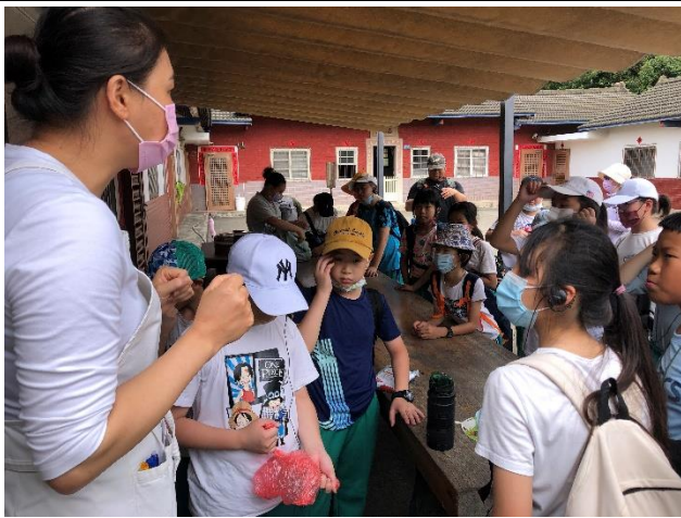
說明：微熱山丘認識土鳳梨酥。